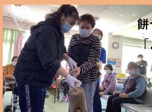
餅つき大会 「よっこいしょ」!